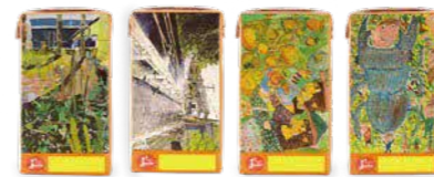
熊日学童スケッチ展の入賞作品をパッケージに掲載しています。

青果物の生産指導・販売及び清涼飲料水の製造販売や農産物の加工販売を行っています。商品の一つである「ジュシーみかん100(125ml)」は熊本のみかんをふんだんに使用した果汁100%ジュースです。今年で学校給食に導入して50周年を迎え、長年愛され続けています。通販サイトでも販売しておりますので、是非ご賞味ください。